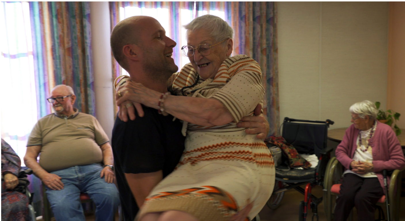
image extraite du documentaire réalisé à l'Ehpad de Hérisson